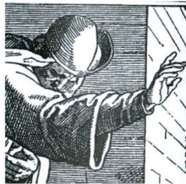
Esdras predica la ley, ilustración de Julius Schnorr